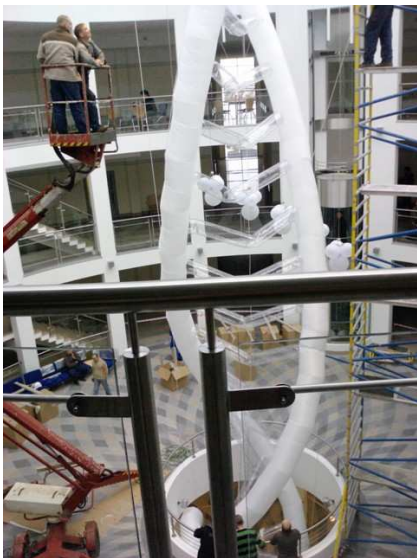
Montaż DNA w kadrze uchwyciła Ewa Kranc i grupa animacji zaocznej, sem. IV